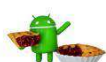
Pie Android 9.0 6 ago. 2018