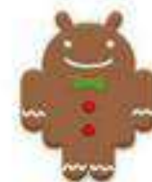
Gingerbread Android 2.3 fine 2010