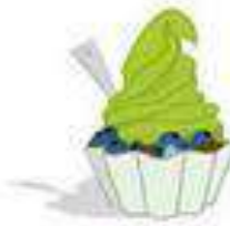
hotspot Froyo Android 2.2 20 magg. 2010