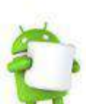
impronte digitali Marshmallow Android 6.0 5 ott. 2015