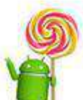
Lollipop Android 5.0 15 ott. 2014