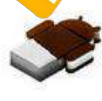
Ice Cream Sandwich Android 4.01 19 ott. 2011