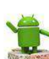
Nougat Android 7.0 22 ago. 2016