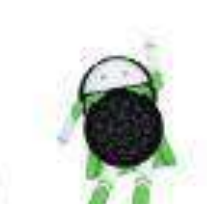
picture-in-picture Oreo Android 8.0 21 ago. 2017