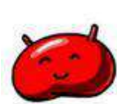
Jelly Bean Android 4.1 27 giu. 2012