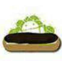
Eclair Android 2.0 27 ott. 2009