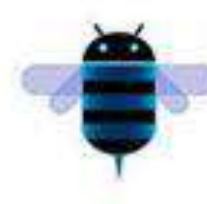
tablet Honeycomb Android 3.0 27 gen. 2011