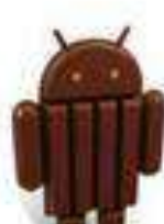
Ok Google KitKat Android 4.4 31 ott. 2013