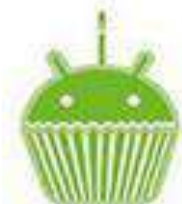
Cupcake Android 1.5 13 apr. 2009